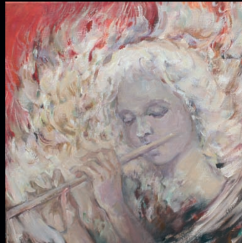
„Weisser Engel“, 60 x 60, Öl, Leinwand, 2006.

Lydia Schigimont Köln www.schigimont-art.de