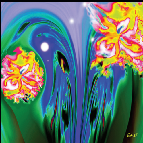
„Elegie“, Computergrafische Malerei, 90x90 cm.