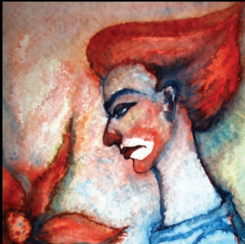
„Identität eines Clowns“, o. R. 43 x 60 cm, Aquarell.

Elke Koch Langerwehe-Hamich www.gemalteimpressionen.de